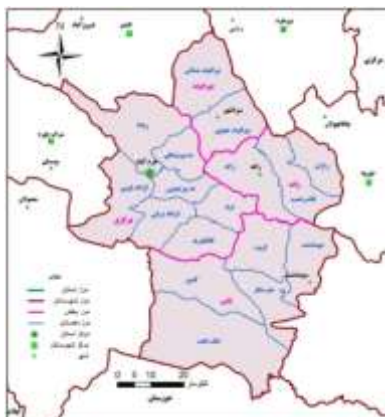
شکل ۱- نقشه تقسیمات سیاسی شهرستان خرم آباد