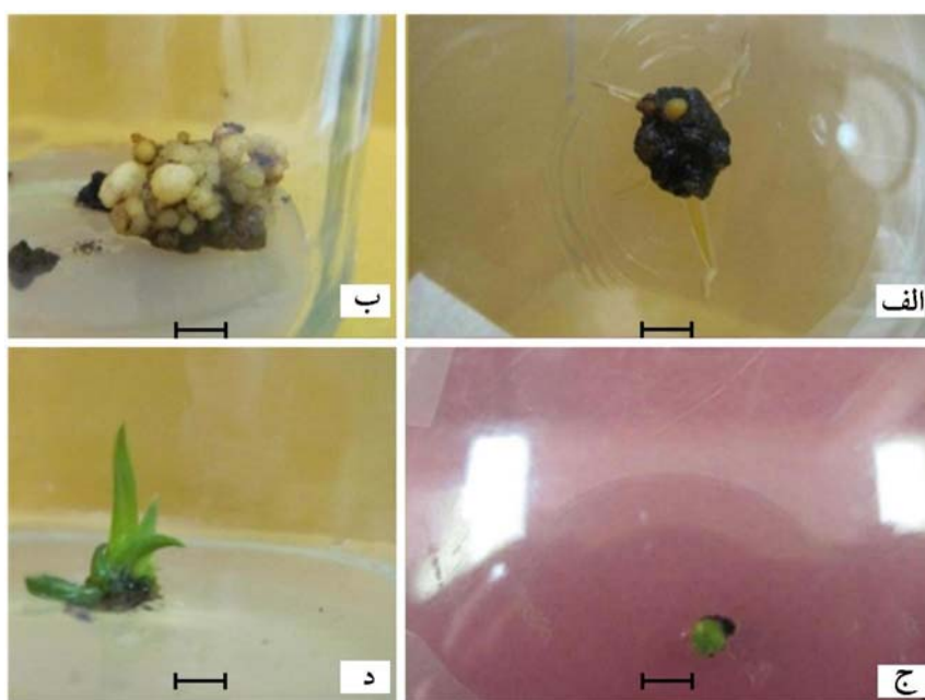
شکل ۲- مراحل جنین‌زایی رویشی غیرمستقیم، مقیاس ۱/۰-cm الف) تشکیل جنین رویشی بر روی بافت کالوس، ب) ازدیاد جنین‌زایی رویشی، ج) بلوغ جنین به صورت تشکیل ساقه و د) افزایش طول ساقه